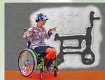
Handi-K@'s Ekstern afdeling under Høskoven

Engtoften 7A 8260 Viby J Tlf: 78 47 73 80 Fax: 78 47 73 94