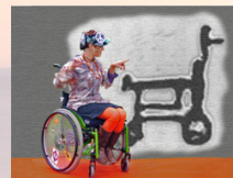
Handi-K@ er en ekstern afdeling under Høskoven

Engtoften 7A 8260 Viby J Tlf: 78 47 73 80 Fax: 78 47 73 94