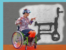
Handi-K@ er en ekstern afdeling under Høskoven

Engtoften 7A 8260 Viby J Tlf: 86 11 37 77 Fax: 86 11 67 86 handi-ka@handi-ka.dk www.handi-ka.dk